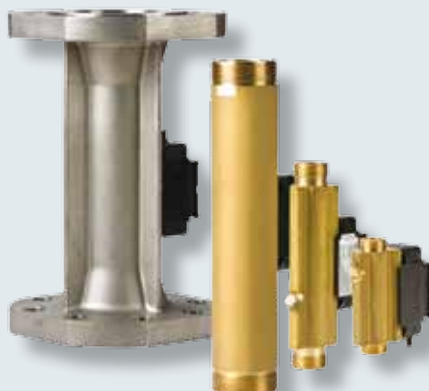
Prietokomery ULTRAFLOW® q_p 0,6 až 40 m 3 /h