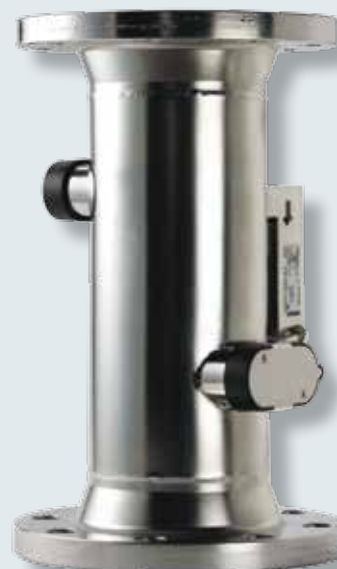
Prietokomery ULTRAFLOW® q_p 60 až 1.000 m 3 /h